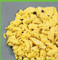
Orientalisches Rührei IQF

10 kg / 250 kg palletbox Lagerung min -18°C MHD 12 Monate