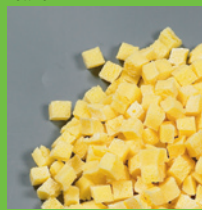
Omelette-Würfel IQF 10x10 mm

10 kg / 250 kg palletbox Lagerung min -18°C MHD 12 Monate