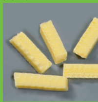
Omelette-Streifen IQF 5x5x20 mm

10 kg / 250 kg palletbox Lagerung min -18°C MHD 12 Monate