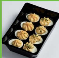
Frische-Tray - standard Topping