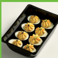
Frische-Tray - luxus Topping

Brötchen/sandwiches Salate Gemüseteller Eier in Senfsauce